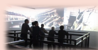
最大震度7のリアルな震災体験

参加された皆様はこれらの擬似体験などを通じて、災害への備えの重要性を実感されました。