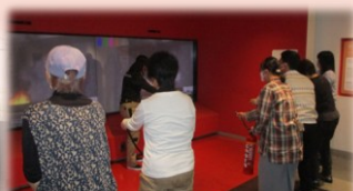
レーザー型消火器で消火体験