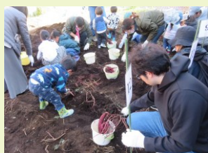
サツマイモ＆里芋収穫祭