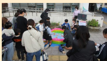
入口前広場のイベント「紙の魚釣りゲーム」&「輪投げ」