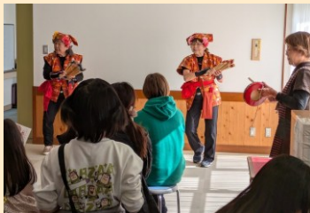
日本古来の大道芸「南京玉すだれ」

昨年11月16日(日)に当館主催最大のイベント『センターまつり2025』を開催しました。