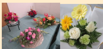
フラワーアレンジメントの展示とワークショップ