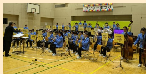
ステージのフィナーレを飾った「横浜隼人中学・高等学校 吹奏楽部」