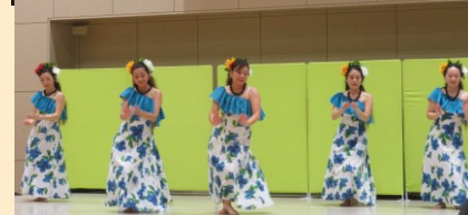
ステージ発表初出場「YAT48 アグリッターガールズ」(上)と「ミリミリフラサークル」(下)